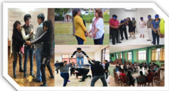
Deelnemers in Zuid-Amerika met elkaar aan de slag