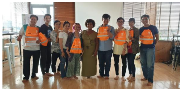
Groep 162 in Vietnam, met Libre-tasjes